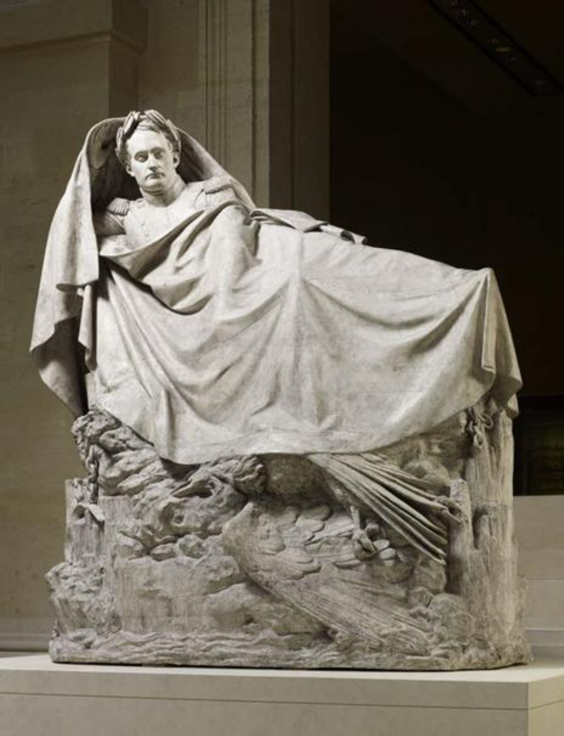
François Rude (Dijon, 1784 – Paris, 1855), Le Réveil de Napoléon , 1846, plâtre, Paris, musée du Louvre.