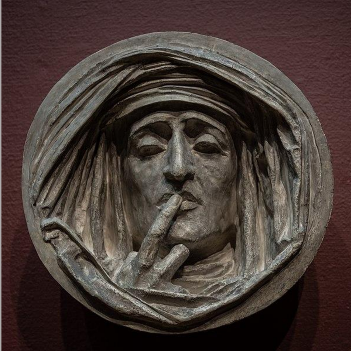
Antoine-Augustin Préault (Paris, 1809 – Paris, 1879), Le Silence , vers 1842, bronze, Auxerre, musée des Beaux-Arts.