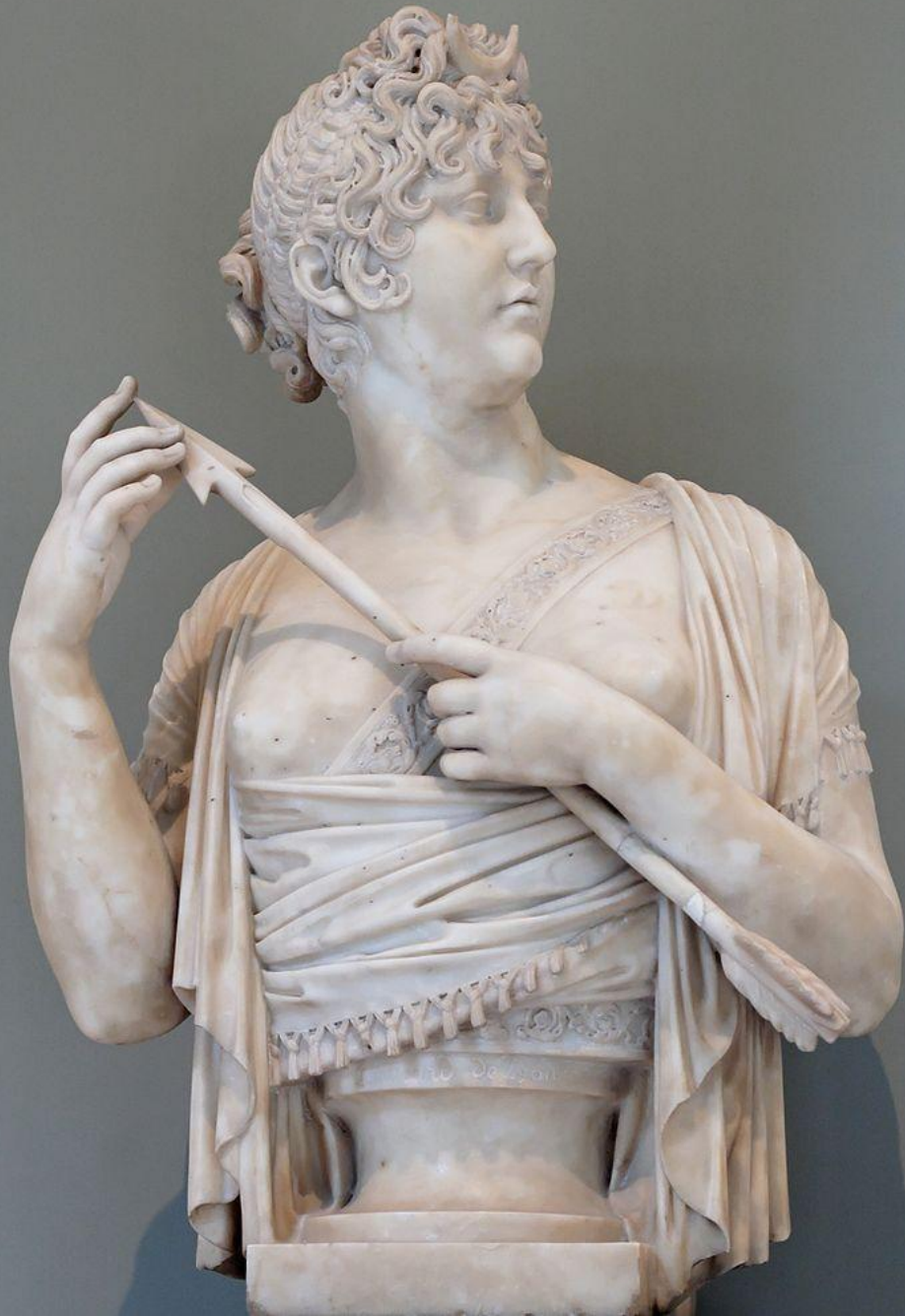
Joseph Chinard (Lyon, 1756 – Lyon, 1813), Madame de Veninac en Diane chasseresse , 1800/8, marbre, Paris, musée du Louvre.