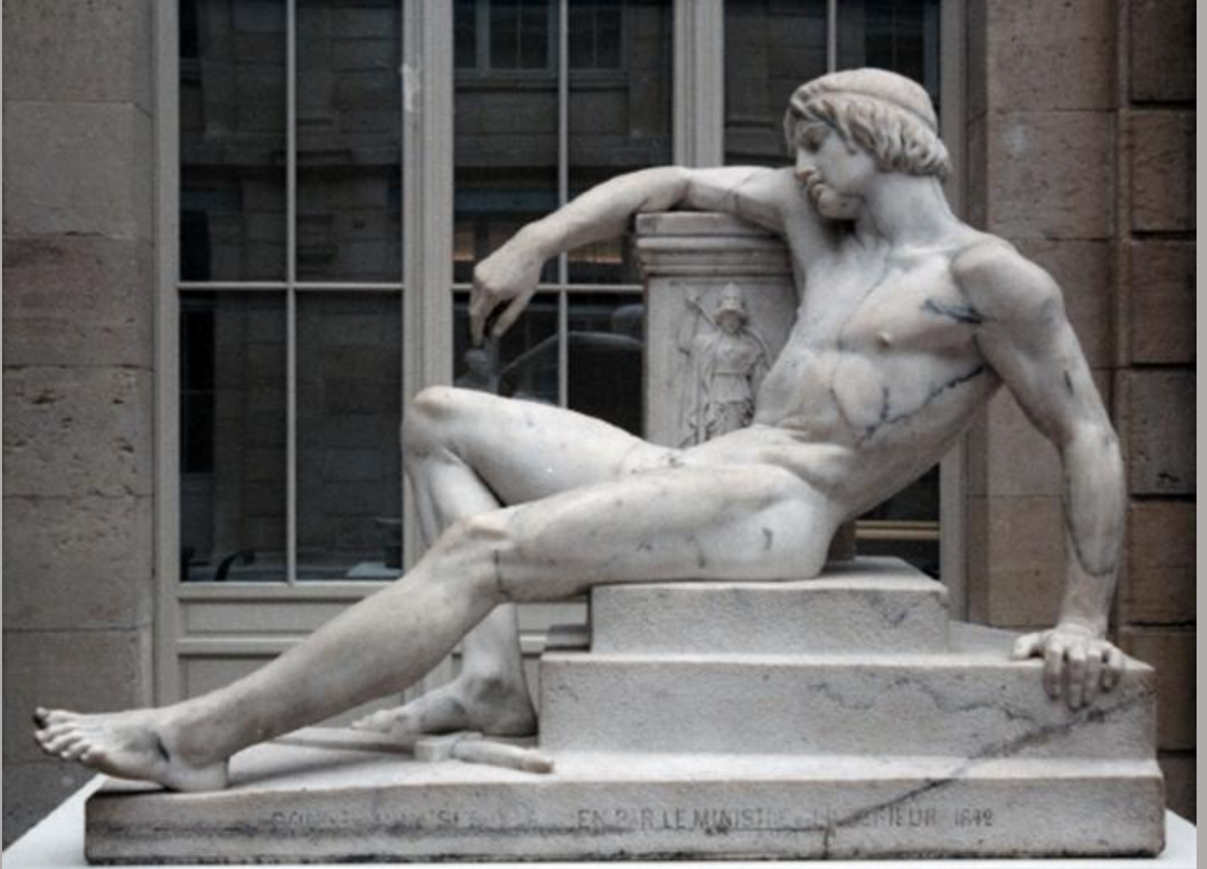
Pierre-Charles Simart (Troyes, 1806 – Paris, 1857), Oreste réfugié sur l'autel de Pallas , 1839/40, marbre, Rouen, musée des Beaux-Arts.