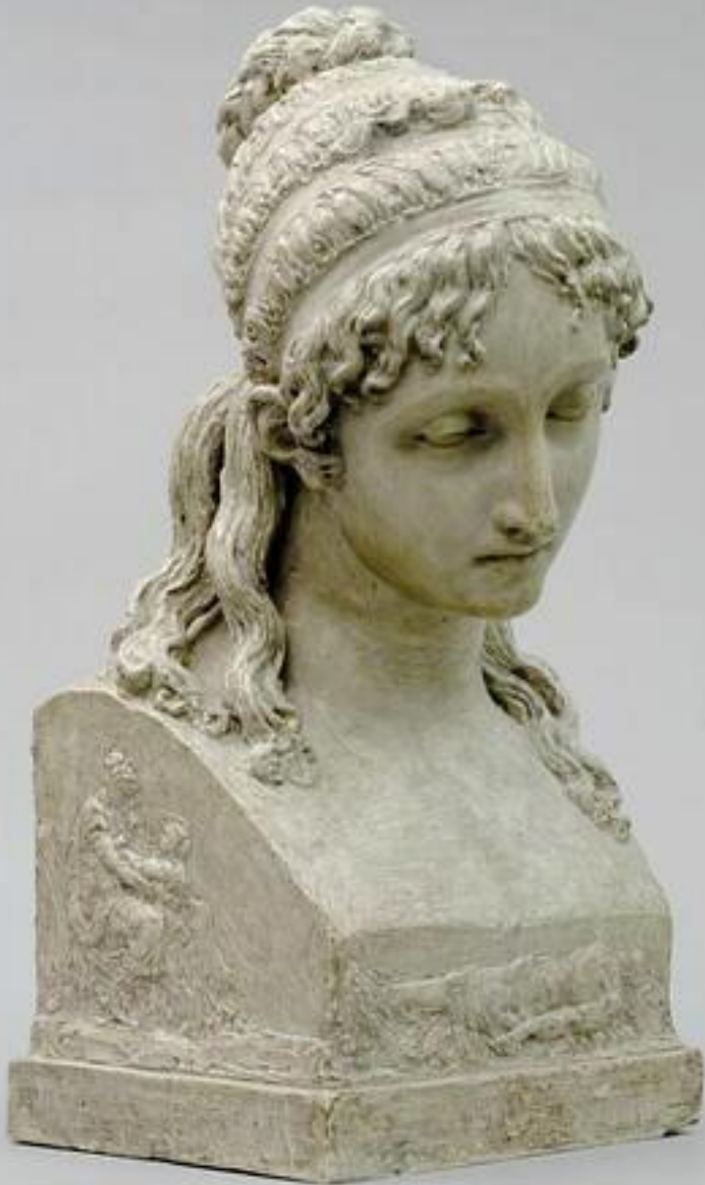
François-Dominique-Aimé Milhomme (Valenciennes, 1758 – Paris, 1823), Andromaque , 1800, plâtre, Paris, musée du Louvre.