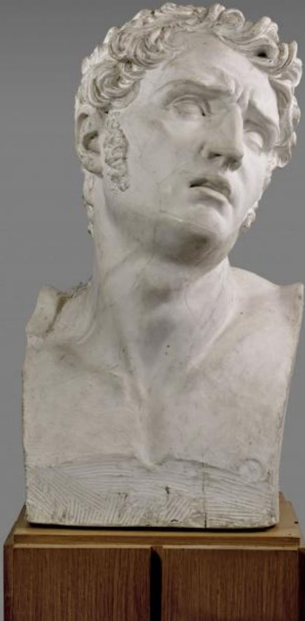
Pierre-Jean David d'Angers (Angers, 1788 – Paris, 1856), Douleur , 1811, plâtre, Paris, Ecole nationale supérieure des Beaux-Arts.