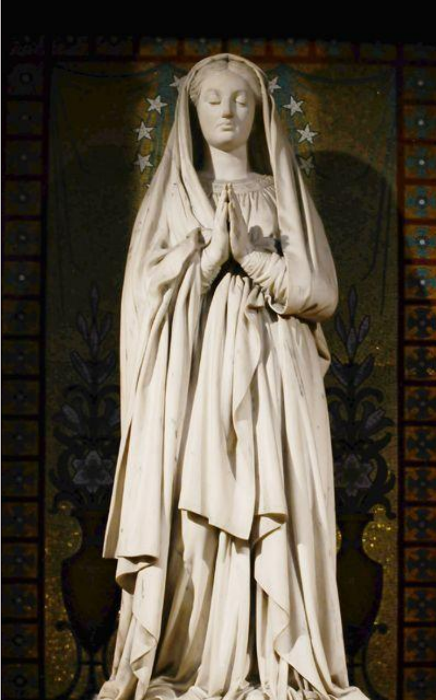
Augustin Dumont (Paris, 1801 – Paris, 1884), La Vierge , vers 1840, marbre, Paris, Notre-Dame de Lorette.