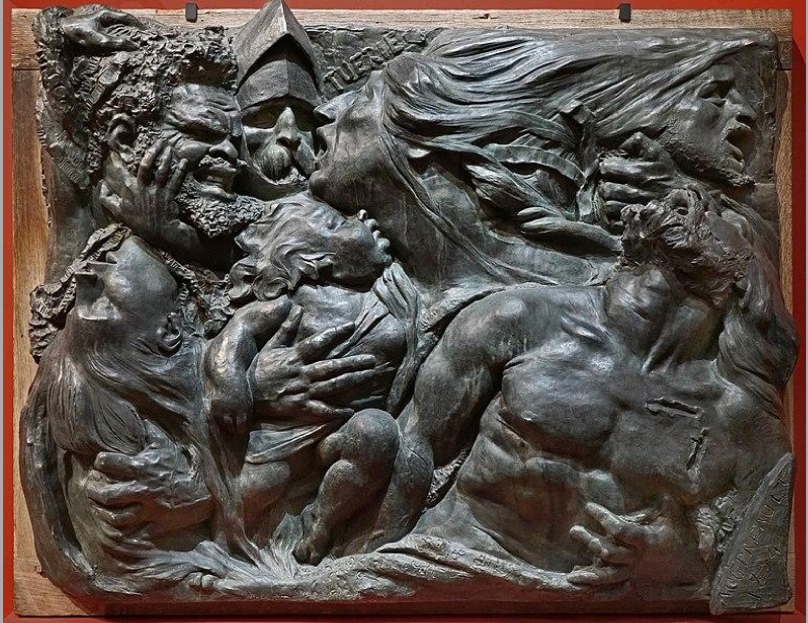
Antoine-Augustin Préault (Paris, 1809 – Paris, 1879), Tuerie , 1834/50, bronze, Chartres, musée des Beaux-Arts.