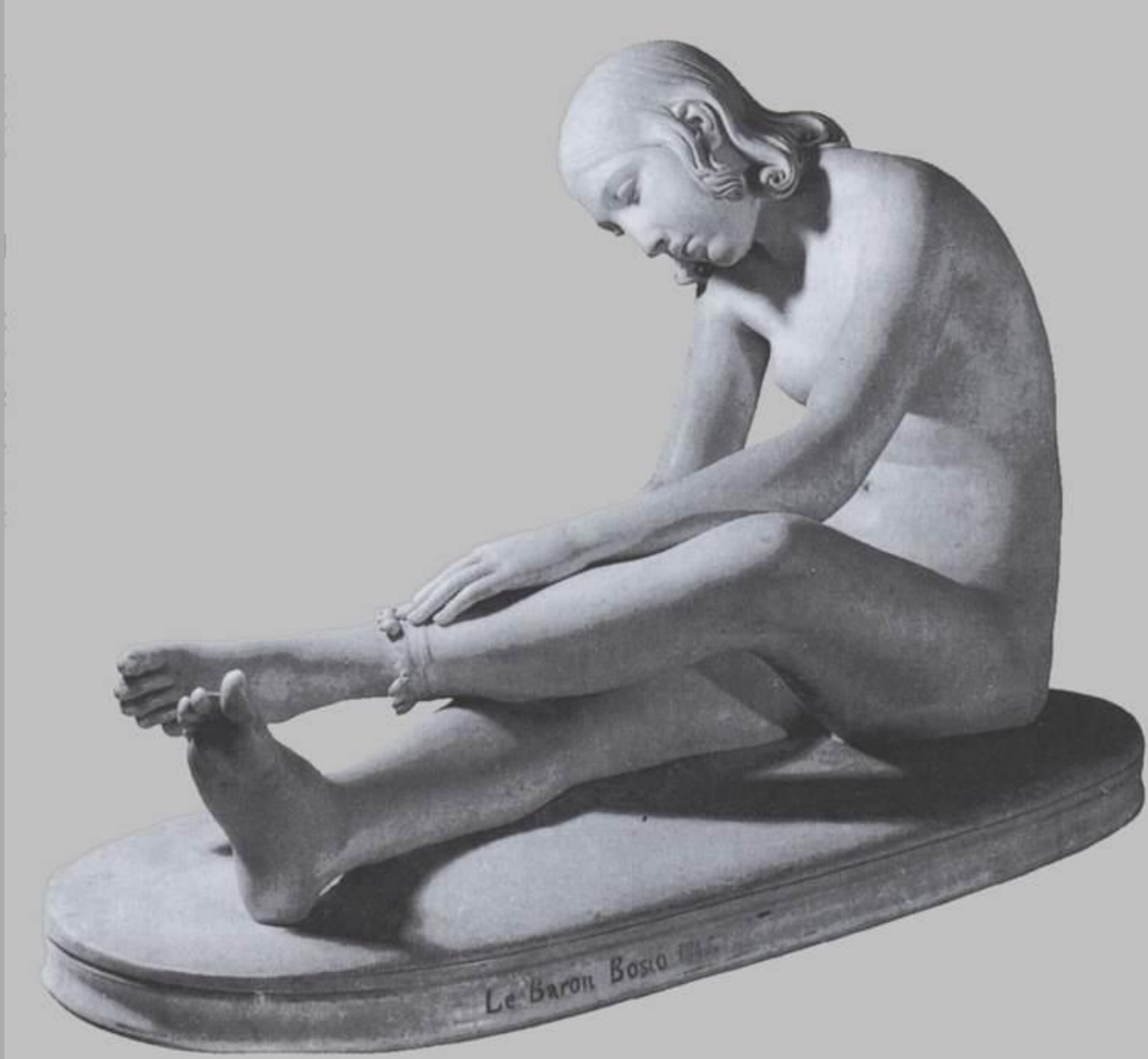
François Joseph Bosio (Monaco, 1768 – Paris, 1845), Jeune indienne ajustant autour de sa jambe une bandelette ornée de coquillages , 1845, marbre, Avignon, musée Calvet.