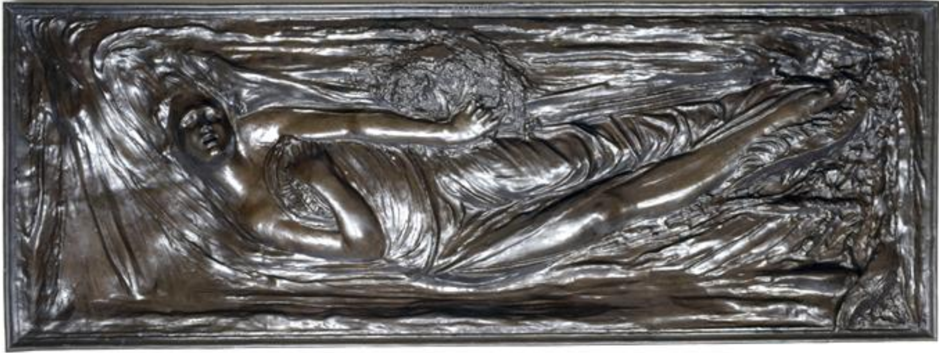
Antoine-Augustin Préault (Paris, 1809 – Paris, 1879), Ophélie , 1842, bronze, Paris, musée d'Orsay.