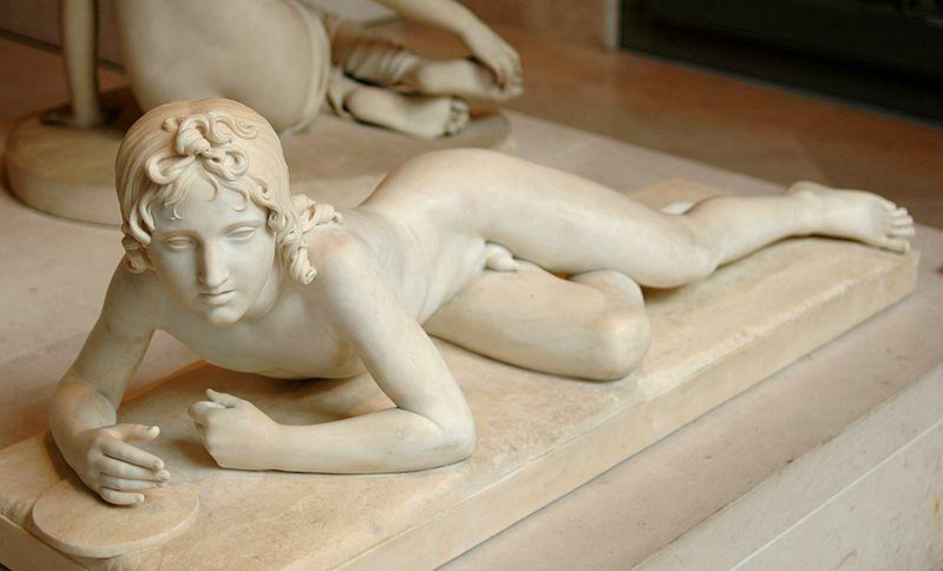
François Joseph Bosio (Monaco, 1768 – Paris, 1845), Hyacinthe , 1817, marbre, Paris, musée du Louvre.