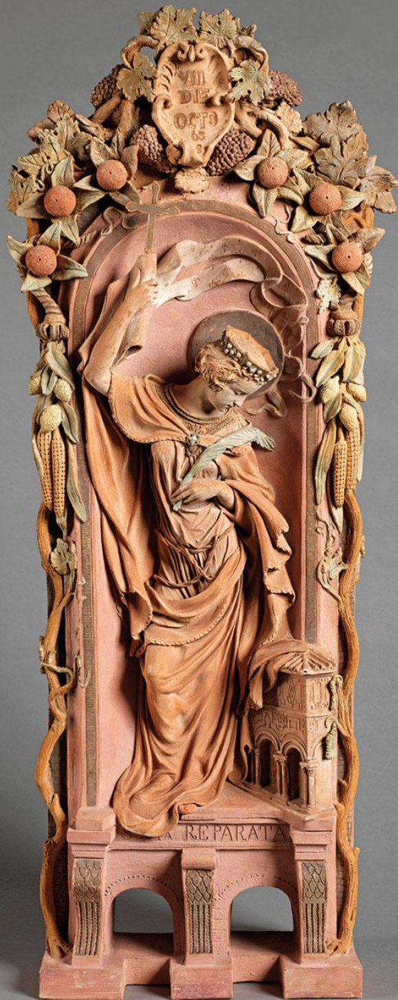
Félicie de Fauveau (Livourne, 1801 – Florence, 1886), Sainte Reparata , 1855/65, terre cuite, Paris, musée du Louvre.