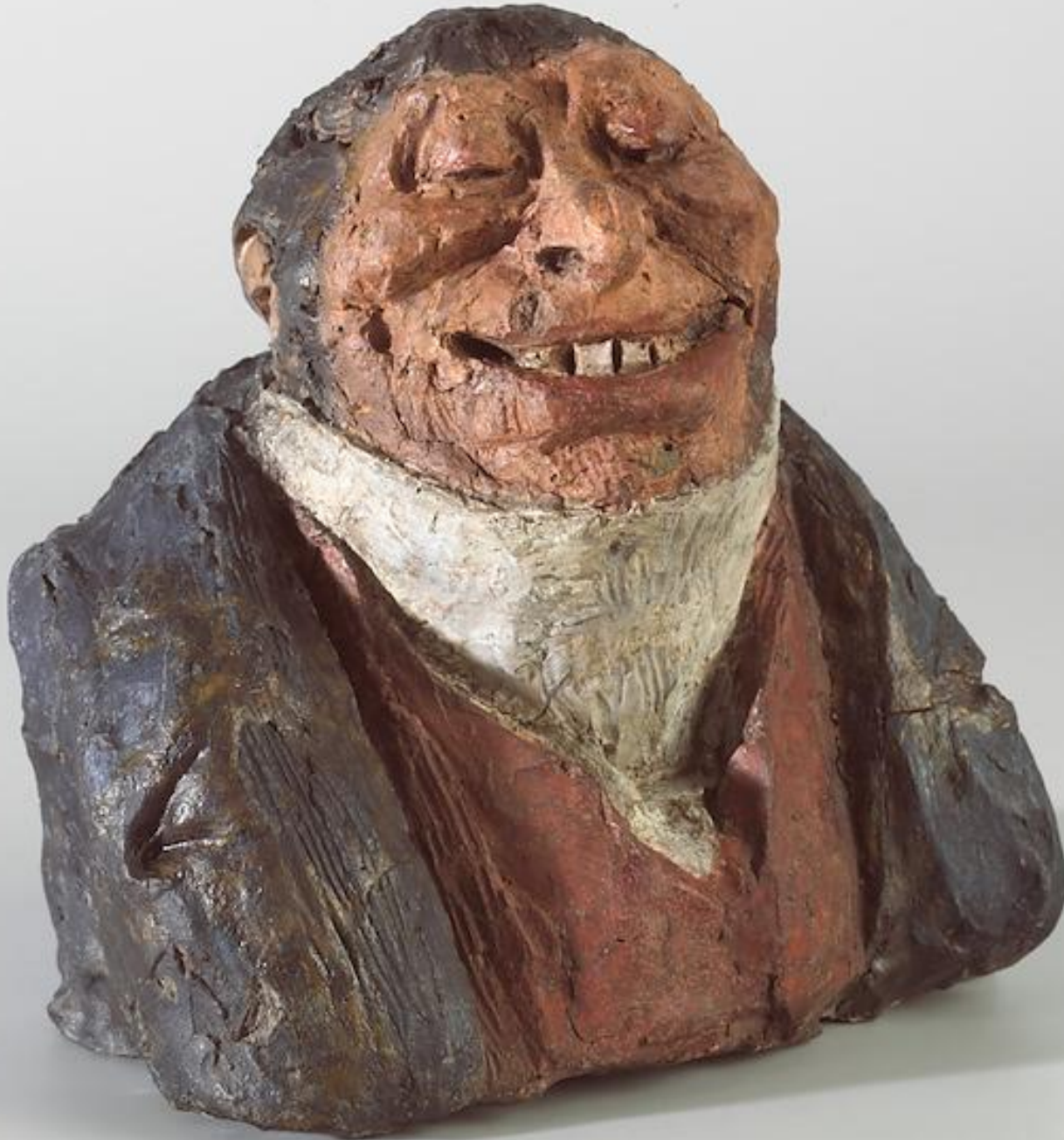
Honoré Daumier (Marseille, 1808 – Valmondois, 1879), Comte Auguste Hilarion de Kératry , 1831, terre crue peinte, Paris, musée d'Orsay.