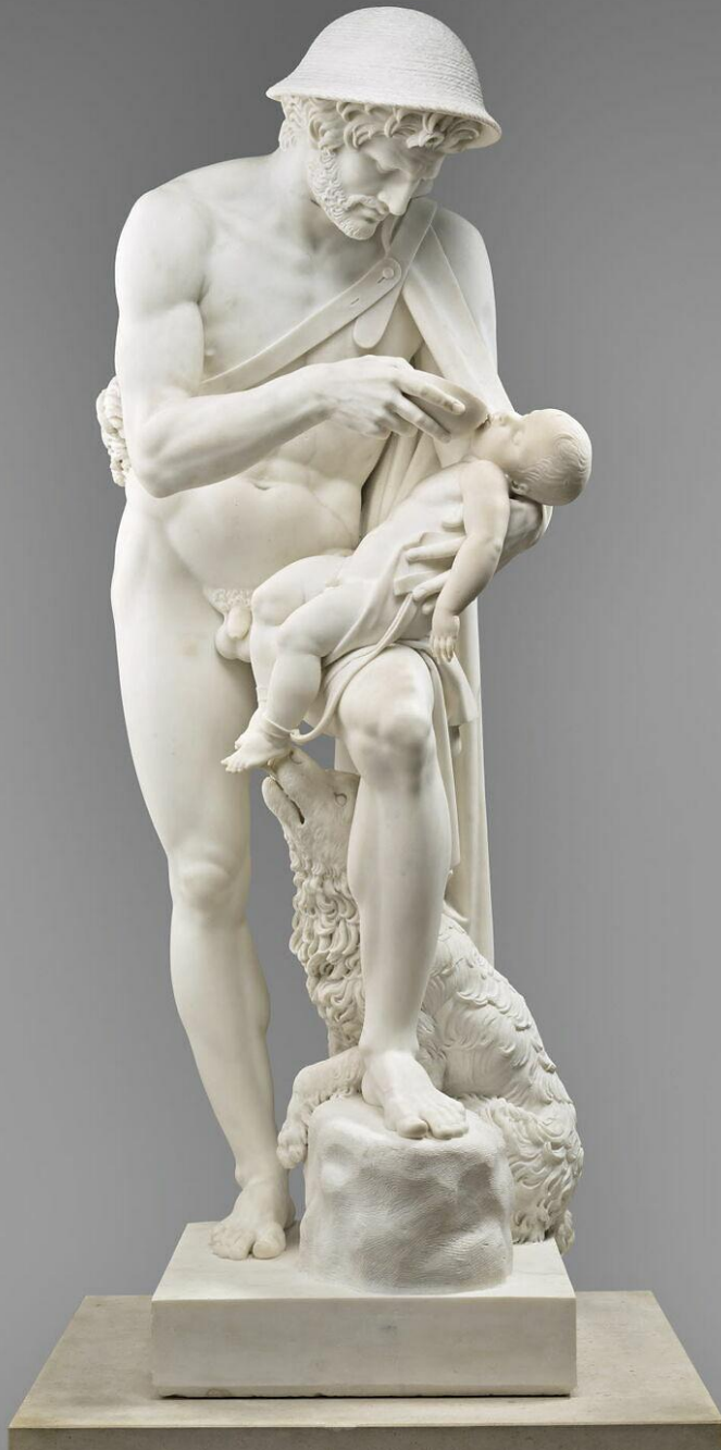
Antoine-Denis Chaudet (Paris, 1763 – Paris, 1810), Œdipe enfant rappelé à la vie par le berger Phorbas , 1802/10, marbre, Paris, musée du Louvre.