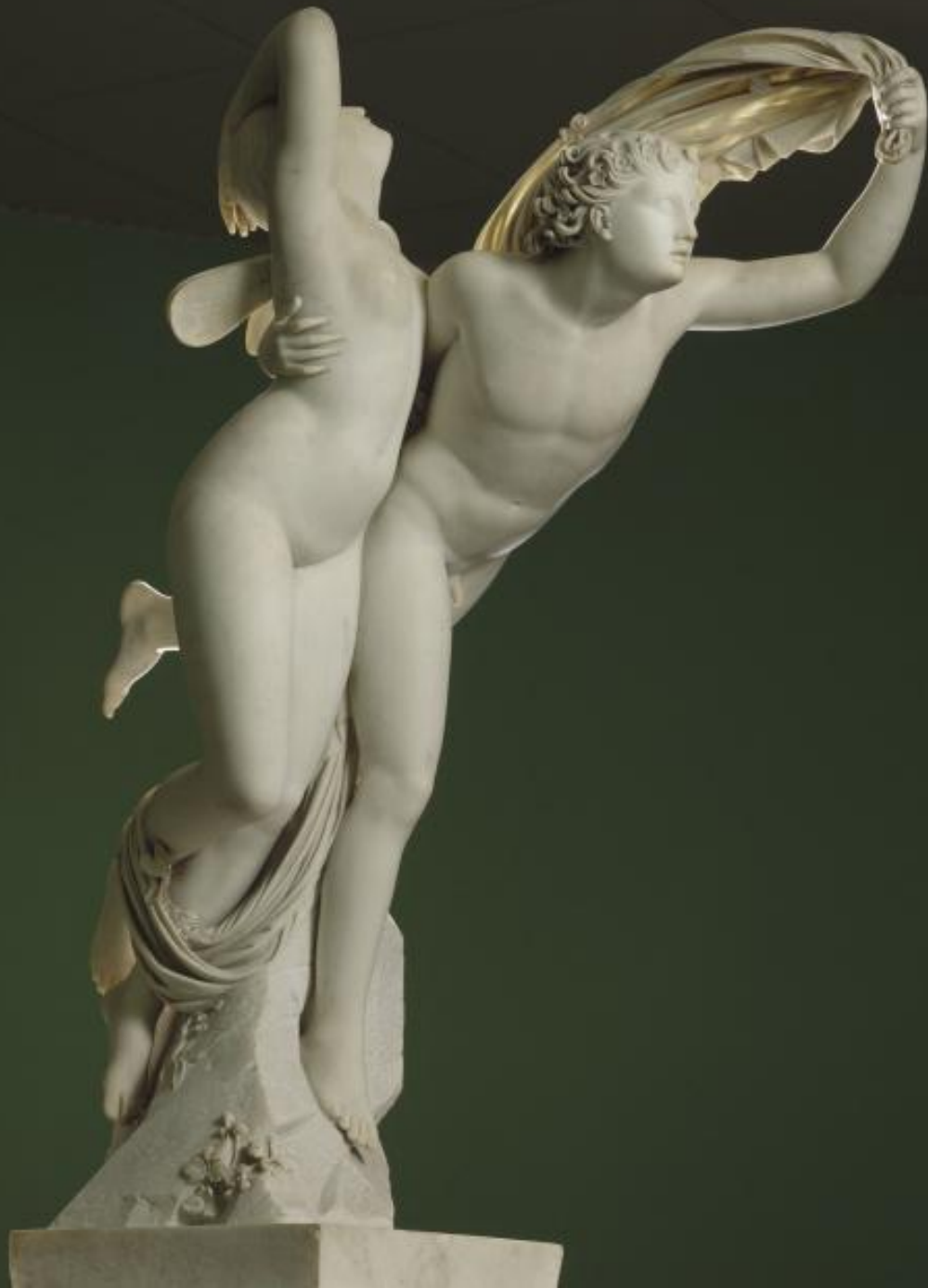
Henri-Joseph Ruxtheil (Lierneux, 1775 – Paris, 1837), Zéphyr enlevant Psyché , 1810/4, marbre, Paris, musée du Louvre.