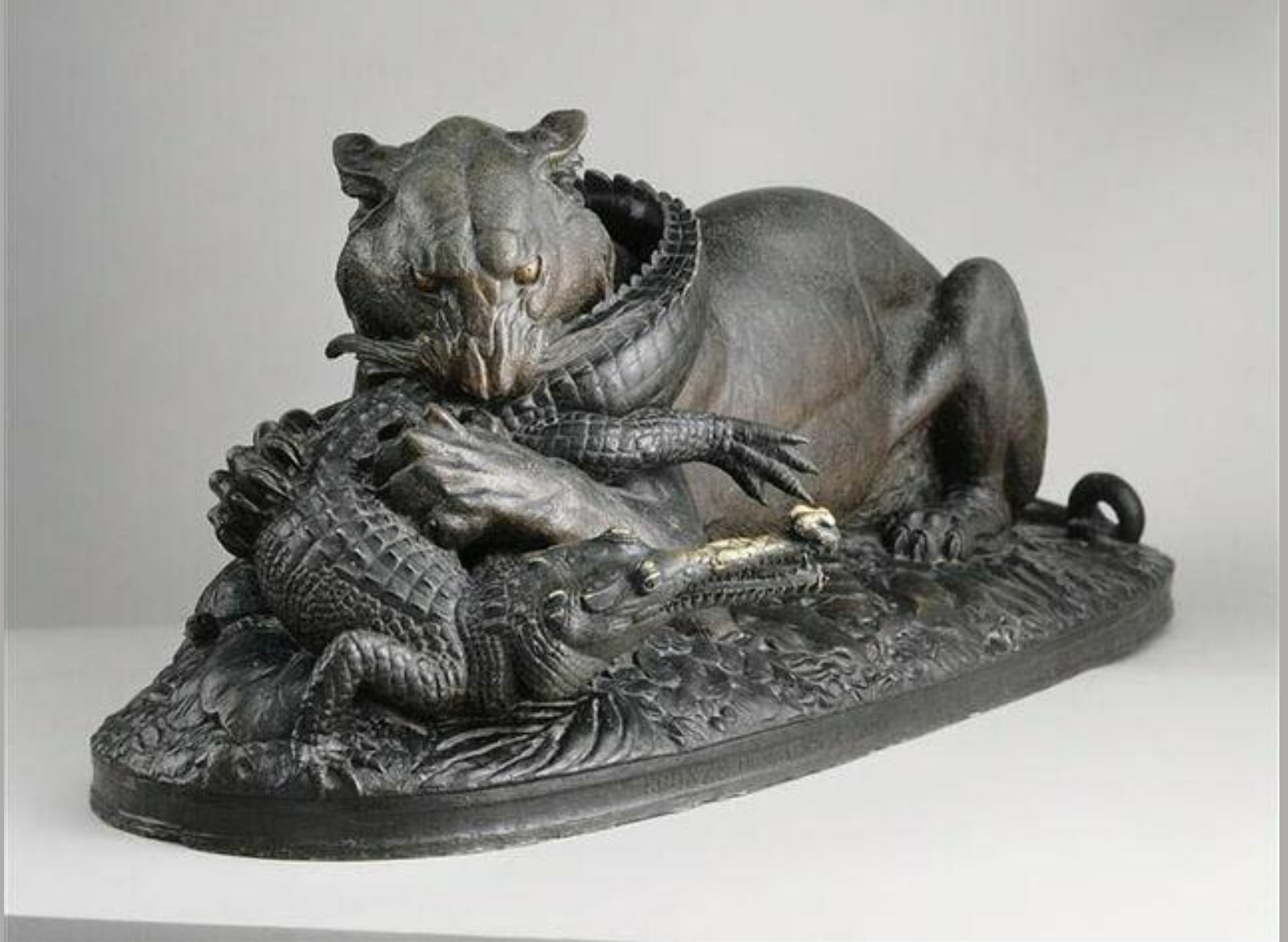
Antoine-Louis Barye (Paris, 1795 – Paris, 1875), Tigre dévorant un gavia , 1831/2, bronze, Paris, musée du Louvre.