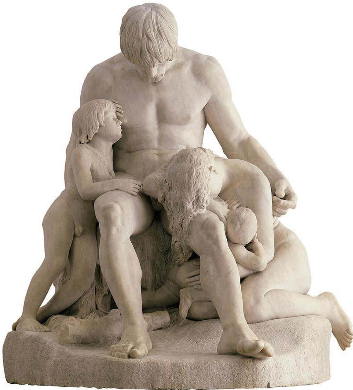
Antoine Etex (Paris, 1808 – Chaville, 1888), Cain et sa race maudits par Dieu , 1832/9, marbre, Lyon, musée des Beaux-Arts.