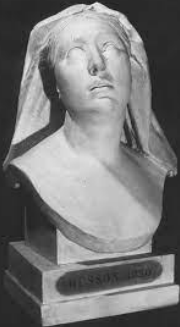
Jean-Aristide Husson (Paris, 1803 – Meudon, 1864), Foi mêlée d'espérance , 1830, plâtre, Paris, Ecole nationale supérieure des Beaux-Arts.