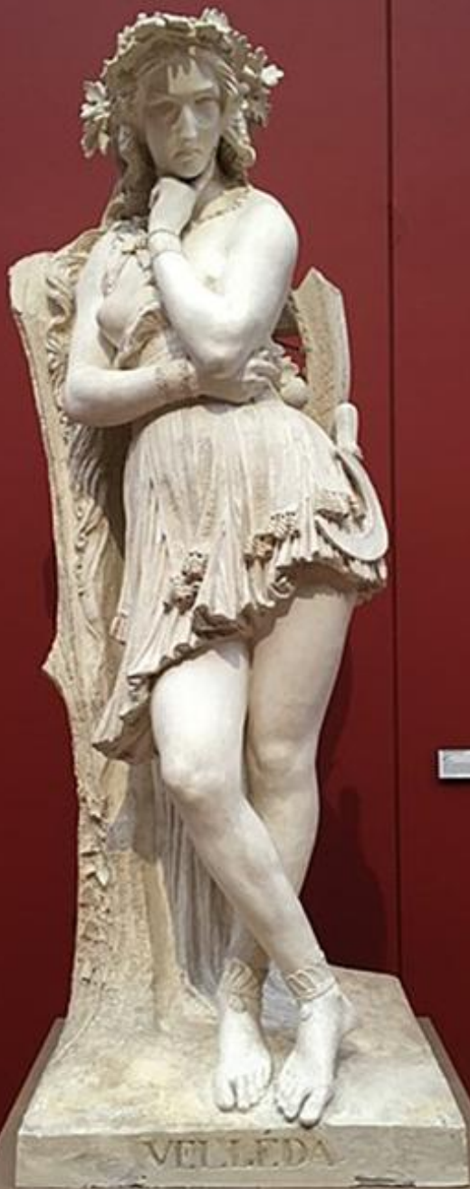
Hippolyte Maindron (Champtoceaux, 1801 – Paris, 1884), Velleda , 1839, plâtre, Angers, musée des Beaux-Arts.