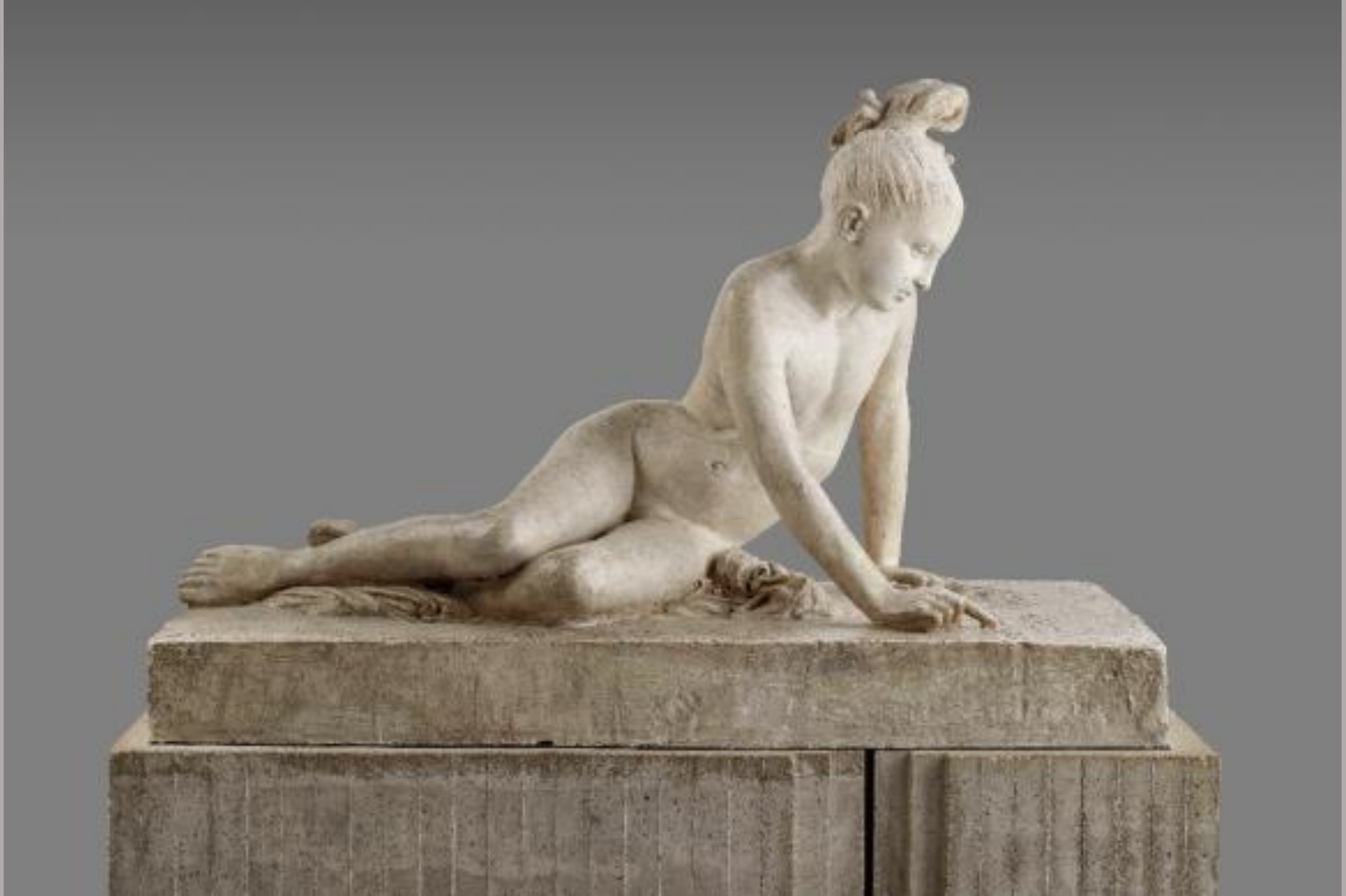
Pierre-Jean David, dit David d'Angers (Angers, 1788 – Paris, 1856), Jeune grecque au tombeau de Marco Botzaris , vers 1825, plâtre, Angers, musée des Beaux-Arts.