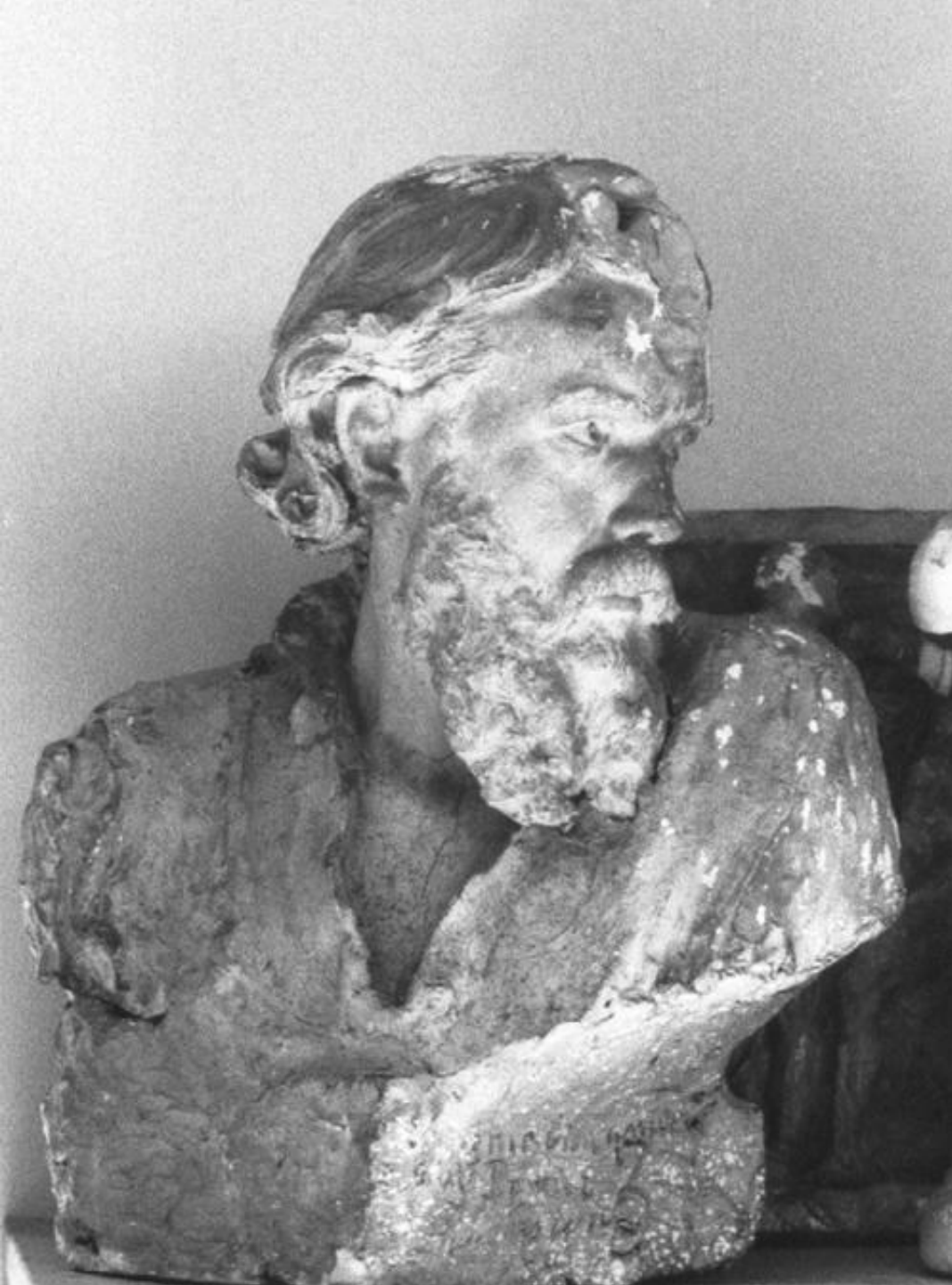
Léo Roussel (Ouches, 1868 – ?, 1943), Résignation , 1894, plâtre, Paris, Ecole nationale supérieure des Beaux-Arts.