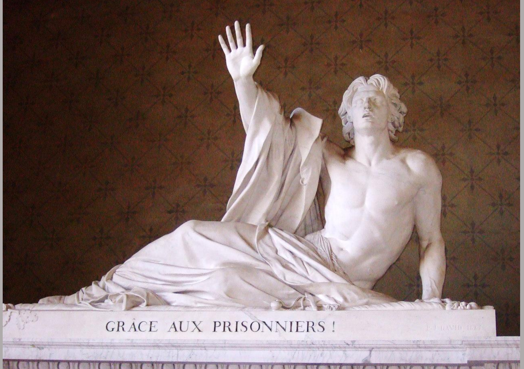
Pierre-Jean David, dit David d'Angers (Angers, 1788 – Paris, 1856), Tombeau du général Bonchamps , 1822, marbre, Saint-Florent-le-Vieil, église abbatiale.