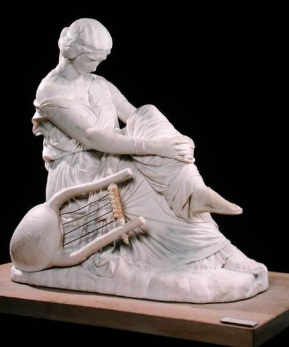
James Pradier (Genève, 1790 - Bougival, 1852), Sappho , 1852, marbre, Paris, musée du Louvre.