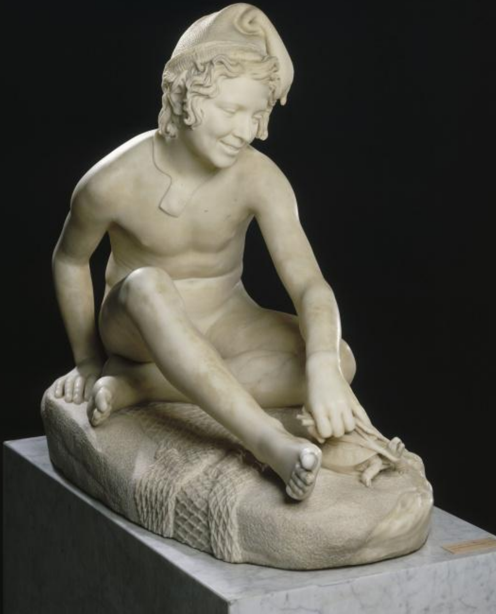
François Rude (Dijon, 1784 - Paris, 1855), Jeune pêcheur napolitain jouant avec une tortue , 1833, marbre, Paris, musée du Louvre.