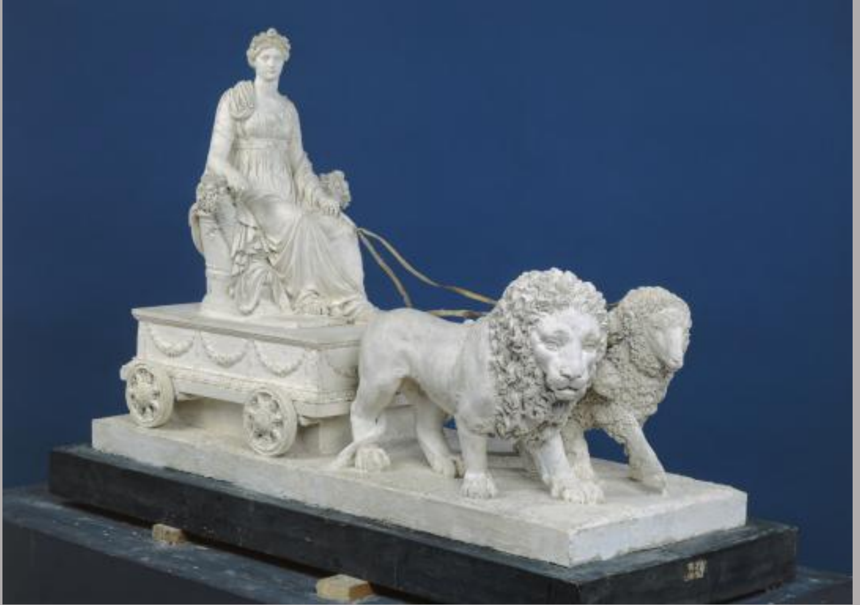
Pierre Petitot (Langres, 1760 – Paris, 1840), La Concorde , 1799, plâtre, Langres, musées.