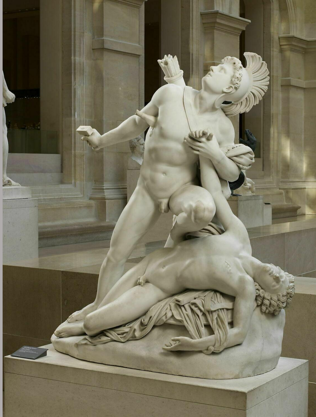
Jean-Baptiste-Louis Roman (Paris, 1792 - Paris, 1835), Nysus et Euryale , 1827, marbre, Paris, musée du Louvre.