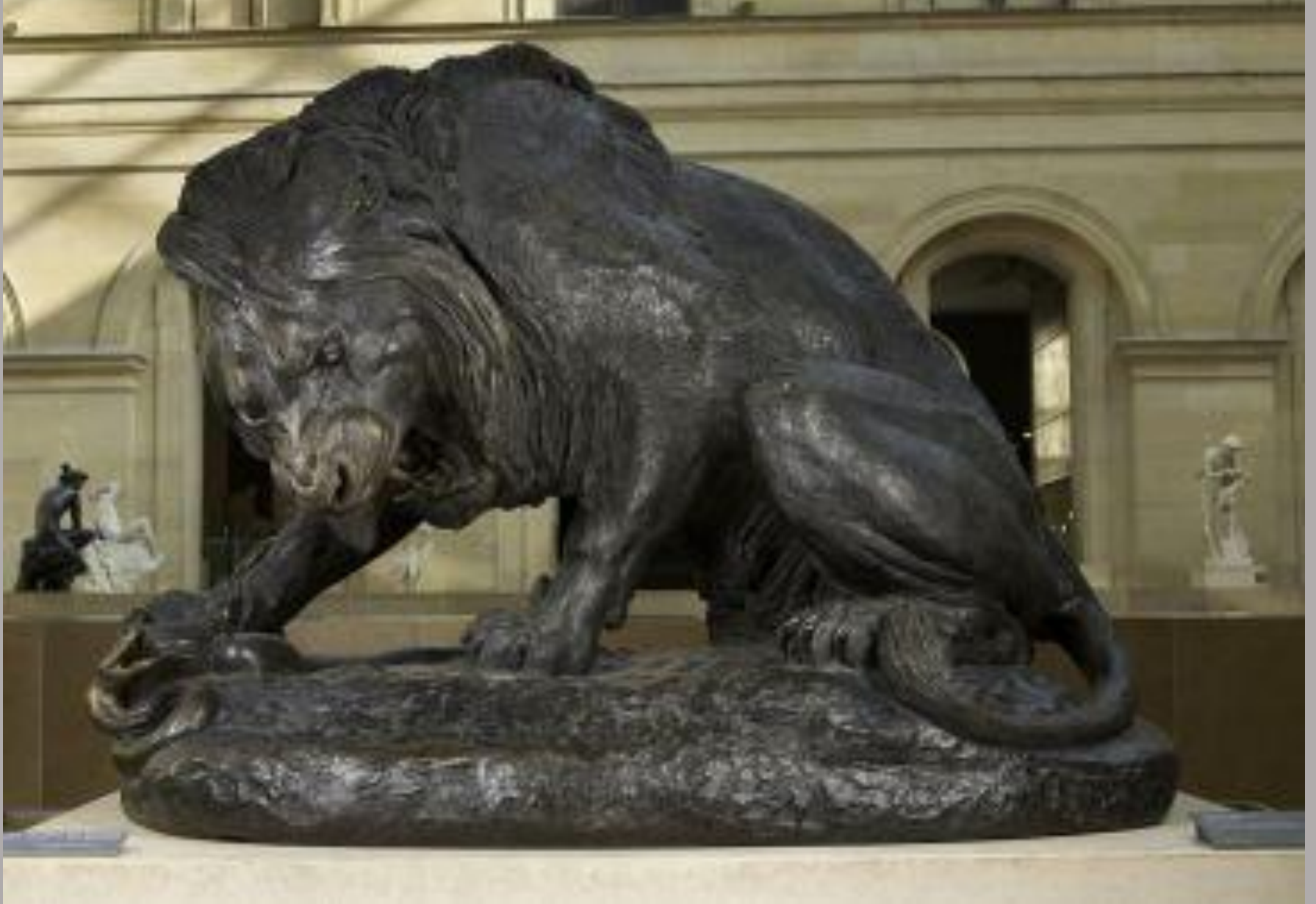
Antoine-Louis Barye (Paris, 1795 – Paris, 1875), Lion et serpent , 1833/6, bronze, Paris, musée du Louvre.